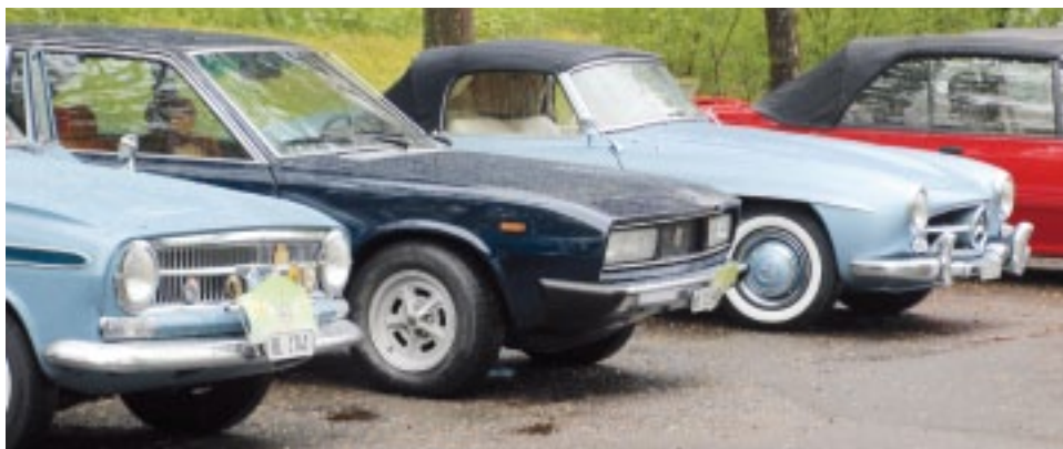
Trotz dem Winterwetter fuhren viele Teilnehmer mit dem Oldtimer vor.