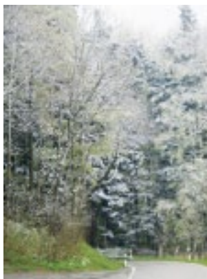
Anfahren mit Wintergruss.