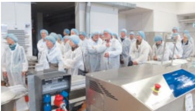
Besichtigung der Fabrikationsanlagen. Aber, es bleibt sehr viel Handarbeit.