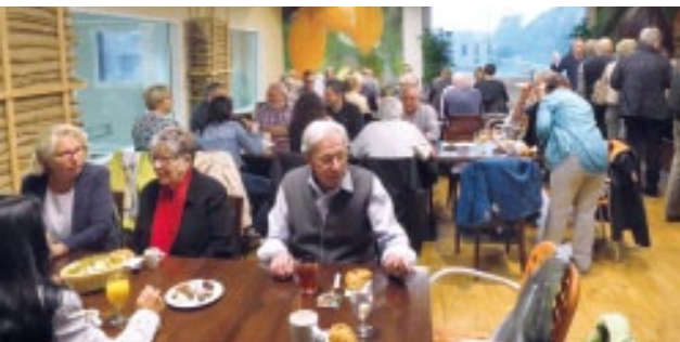
Wenn der SMVC ZS kommt, wird's voll in vielen Lokalen. Das galt auch fürs Mittagessen. Das Restaurant und zwei Säle wurden gänzlich durch uns belegt.

Viele weitere Fotos siehe: www.smvc-zentralschweiz.ch . Dort [Foto-Galerie 2016] und Untermenu [Saison Eröffnung].