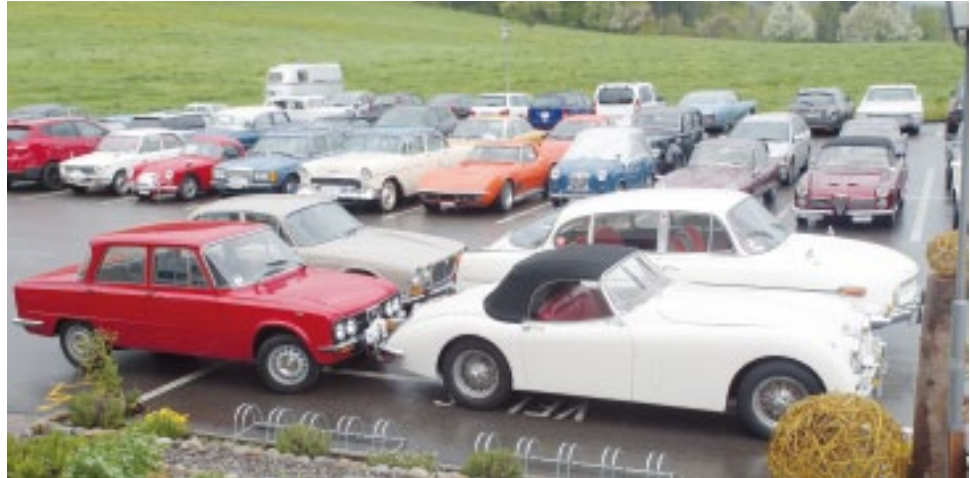
Blick auf den Parkplatz vor dem Restaurant Mühleholz.

Da wurden wir aber sehr symbolträchtig parkiert. Sind nicht auch unsere Oldtimer süss? Aber manchmal doch mit einem bitteren Beigeschmack, wenn die Rechnungen kommen.