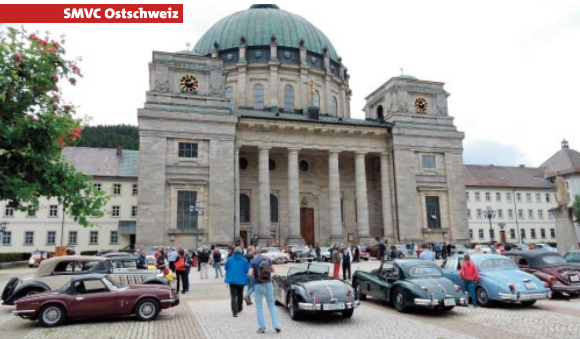
Die SMVC-Oldtimer vor dem Dom St. Blasien.