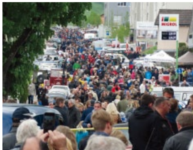
Das SMVC-Zelt in Beromünster, ebenfalls bestens platziert, die Insel im Meer der Besucher.

Impressum siehe Ausgabe: SwissClassics Nr. 55-3 | 2016