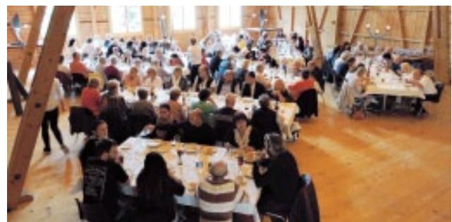
Der Abschluss mit wohlverdienten Köstlichkeiten und der Rangverkündigung mit Steinpokalen für die erfolgreichen Fahrerinnen und Fahrer fand im Restaurant Hirschen statt. (Die Ranglisten sind auf www.smvc.ch zu finden). Glücklicherweise konnte somit die 45. Sommerfahrt zu einem schönen Ende finden.