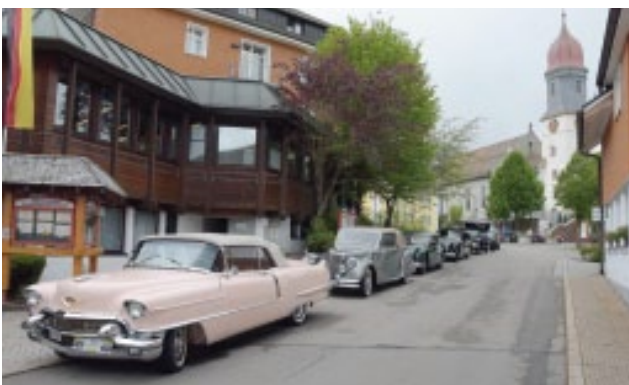
Rund 60 Oldtimerfahrzeuge wurden rund um das Kurhaus in Höchenschwand geparkt.

Weitere Fotos: https://www.smvc.ch/sektionen/ostschweiz