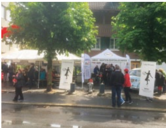
Das eine Zelt, in bester Lage, diente am Samstag in Sarnen als Küche und Buffet und das andere als Gaststube.