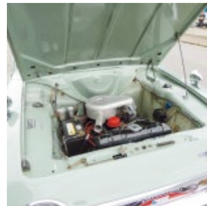
Es kommt nicht auf die Grösse an!

www.smvc.ch/sektionen/zurich siehe: 12. April 2014: Anmeldung und Ausschreibung.