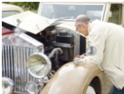
Alles im Griff! Oder doch nicht?

Dieser Anlass ist auch für Mitglieder anderer Sektionen offen.