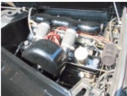
Technik zum Anfassen und Verstehen.