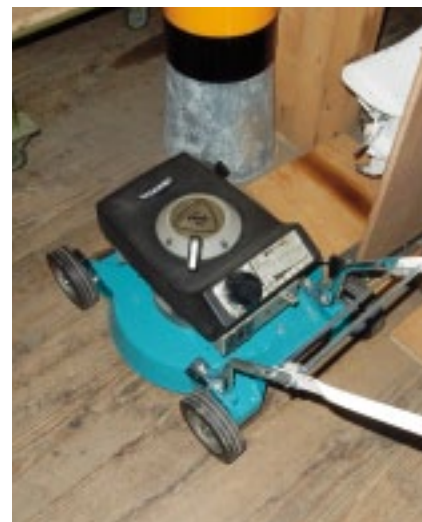
Weitere Bilder, aus der Abteilung Wankel, der Sammlung von Markus Dätwyler.