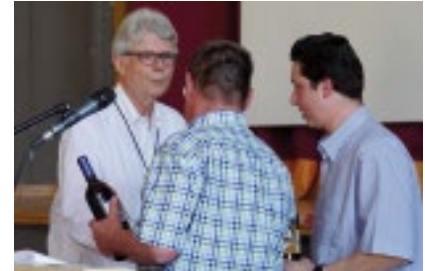
Schweiz: MV und Anfahren, Sonntag 6. Mai 2018

Hier wieder die Zusammenstellung der SMVC Anlässe Anfang Saison bis Ende Mai. Ich weiss von diesen -besonders den nationalen*- und surfe auch durch die Seiten: www.SMVC.ch , www.smvc-zentralschweiz.ch , www.smvc-ladydrivers.ch , www.smvc-ticino.ch , resp. den entsprechenden Fotoservern.