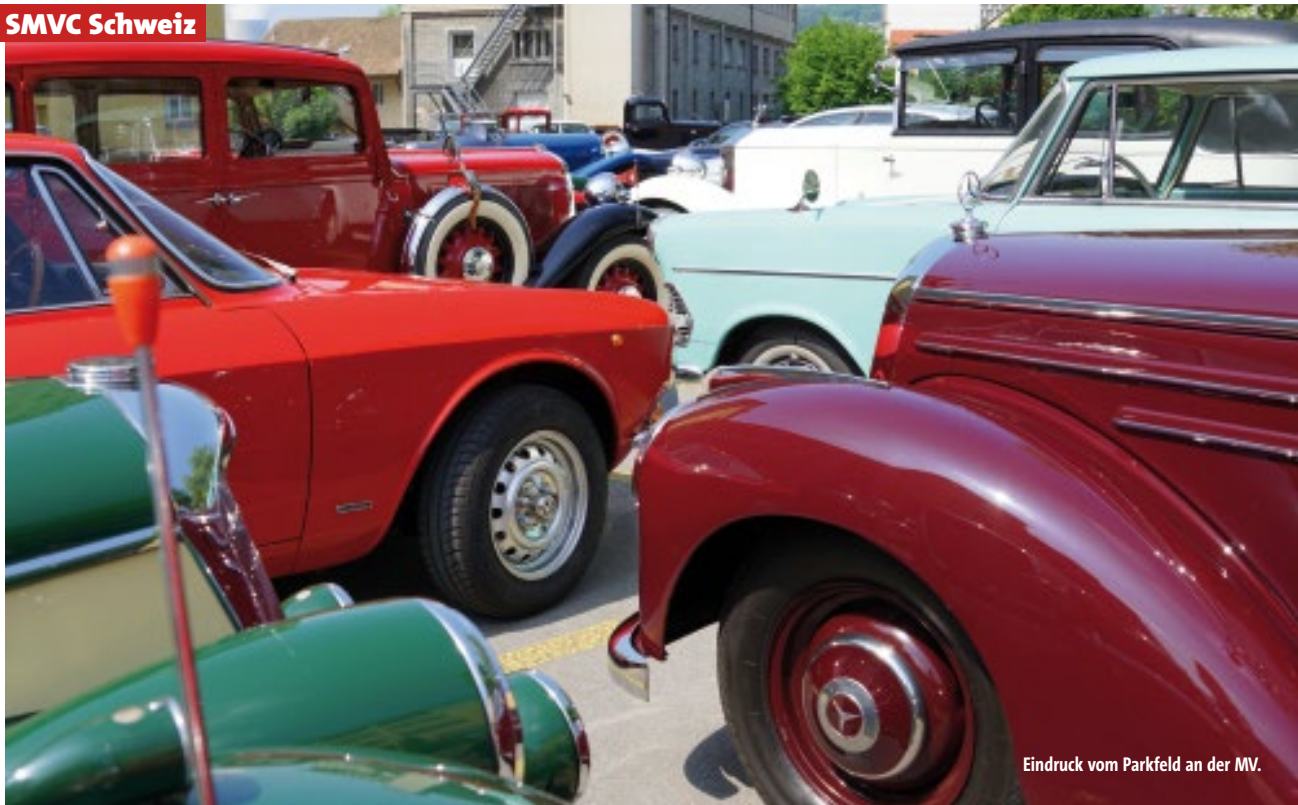
Eindruck vom Parkfeld an der MV.