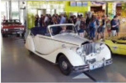
Zentralschweiz: Saisonöffnung, Samstag 21. April 2018