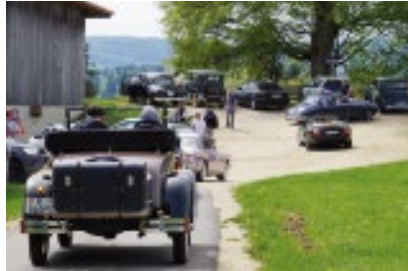
Zürich: Anfahren, Sonntag 29. April 2018