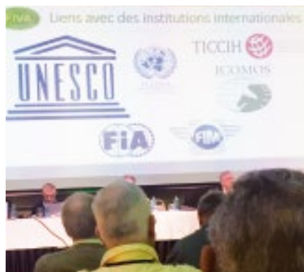
Die FIVA arbeitet mit diesen Organisationen zusammen, weitere Fotos: http://bit.ly/FIVA-GA18

Die Anreise in dieses britische Überseegebiet an der Südspitze Spaniens war mühsam: Flug nach Malaga, Taxi bis zur Grenze, zu Fuss über die Grenze, dann Taxi zum Hotel „Sunborn“, welches einem Schiff nachempfunden ist.