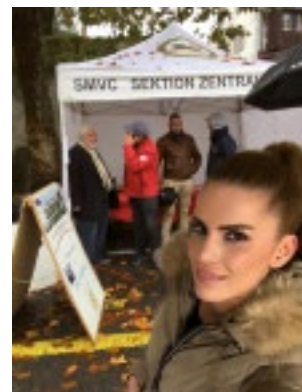
Am SMVC-Stand war ganz schön was los.