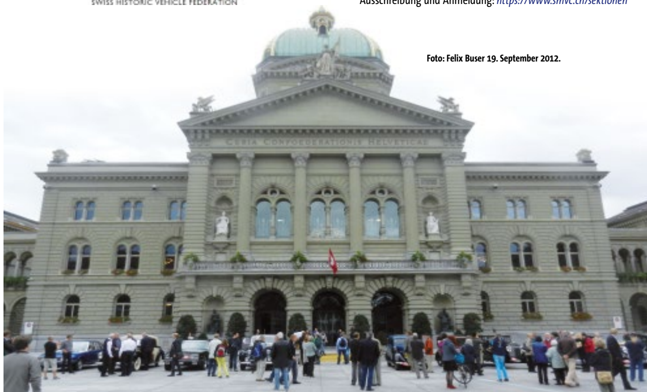
19. September 2012.

Ausschreibung und Anmeldung: https://www.smvc.ch/sektionen