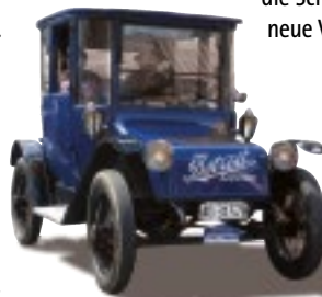
Dieser Detroit von 1918 fuhr schon immer elektrisch.

Frage nach, ob wir das Thema noch ins Programm aufnehmen sollten. Die Antwort vom Chef, Tony Davies, UK, lautete „Nein“. Zum einen sei der Tag schon so reich befrachtet, das Thema komplex und dies sei eine Aufgabe für die FIVA Technical Commission. Ein Mitglied schrieb: „Ein elektrifizierter Oldtimer, wird dann in 30 Jahren eine FIVA ID-Card beantragen können.“ Stimmt so nach dem heutigen FIVA Technical-Code.