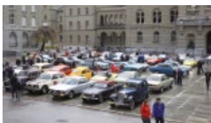
Die linke Hälfte Bundesplatz Bern.

Text: Roger Gillard; Fotos: Jürg Rohr B1, B2; Martin Zobrist, B3, alle Fotos: www.smvc.ch/sektionen