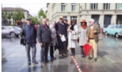
SMVC Gruppen(teil)bild mit Passagieren.