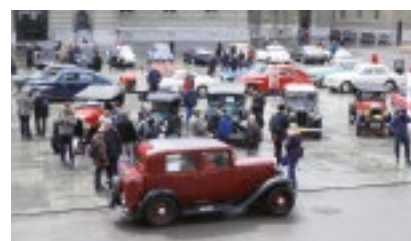
Die rechte Hälfte Bundesplatz Bern.