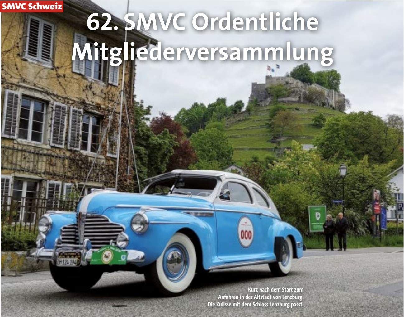
Kurz nach dem Start zum Anfahren in der Altstadt von Lenzburg. Die Kulisse mit dem Schloss Lenzburg passt.