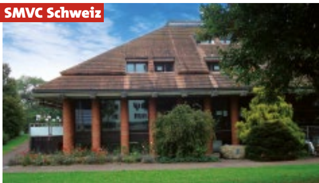
Das Parkhotel Wallberg in Volketswil.