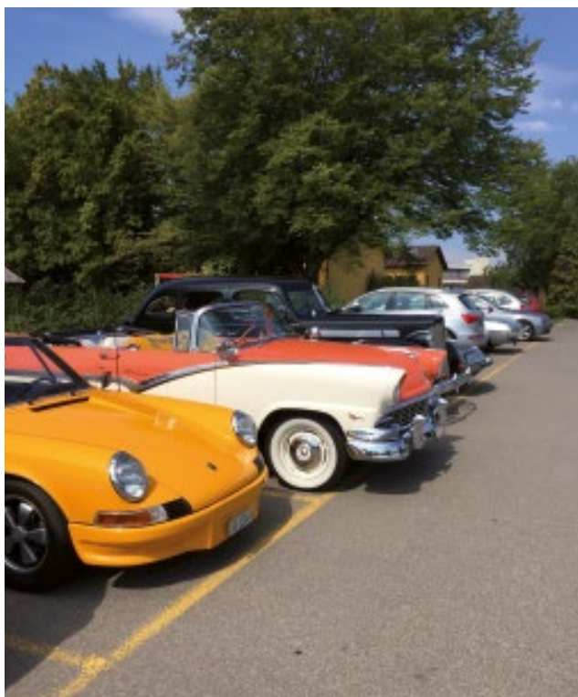
Historische Fahrzeuge von SMVC Mitgliedern auf dem Parkplatz des Parkhotel Wallberg.