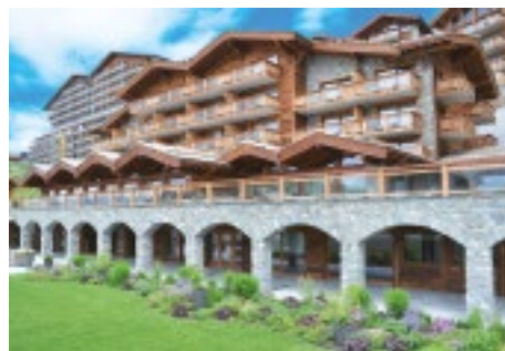
Hotel Nendaz 4 Vallées & Spa, das prachtvolle 4-Sterne Superior-Hotel.