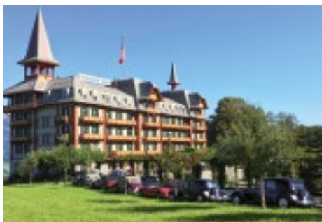
Paxmontana ein Jugendstilhotel und Juwel.

Ich freue mich auf eine schöne Ausfahrt mit Euch!