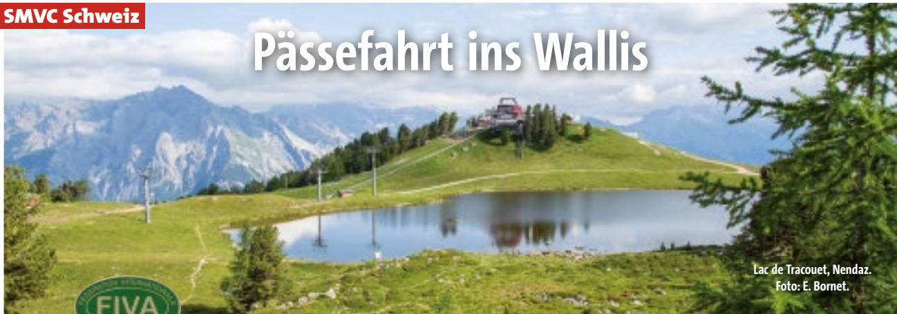
Lac de Tracouet, Nendaz.